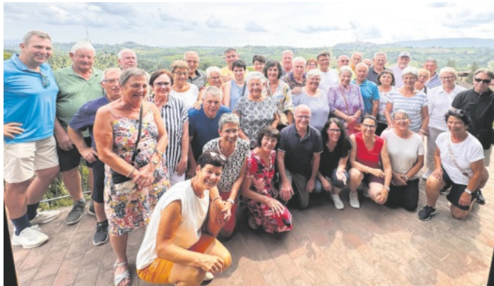
Das Foto zeigt die Reisegruppe (im Hintergrund die Stadt San Gimignano)

Am vierten Tag hieß es dann leider wieder Abschied von dieser „Sehnsuchtsregion“ zu nehmen und am späten Abend kam man wieder mit vielen neuen Eindrücken ist.