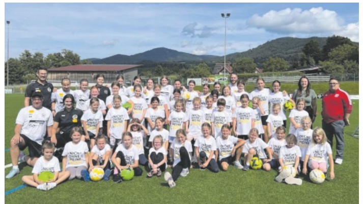
Die teilnehmenden Mädchen

Unter diesem Motto durfte der SV Obersasbach am 31. Juli den "Tag des Mädchenfußballs" des SBFV ausrichten. Der Einladung folgten 35 Mädchen zwischen 6 und 14 Jahren, wobei nur fünf bereits Fußballerfahrung hatten. Sie alle wurden mit einem „Nicht ohne meine Mädels“ T-Shirt ausgestattet, welches sie stolz den ganzen Tag trugen. Betreut von den C-Juniorinnen der Soccer-Girls Obersasbach wurden Übungen, wie Dosenschießen, Fußball-Golf und Hütchen-Parcours absolviert. An einer Geschwindigkeits-Messanlage konnte getestet werden, wie stark man schießen kann. Parallel wurden die Mädels unter der Anleitung der Juniorinnen-Trainern für das abschließende Turnier fit gemacht, wo direkt das Gelernte angewandt wurde. In der Erholungspause konnten sie sich stärken und zusammen mit ihren Betreuerinnen eine Power-Point-Präsentation der Soccer-Girls von ihren Ausflügen zu den SC Freiburg Frauen als Ballmädchen, den SC Freiburg Herren als Einlaufkinder oder der Reise nach Barcelona zum Internationalen Fußball-Turnier anschauen. Die Medaillen die es zu Schluss gab, strahlten genauso wie die Gesichter der Mädels als sie nach Hause gingen. Der SVO hofft, dass nach der Sommerpause viele der Mädels zu einem weiteren Training auf den Sportplatz kommen. (M. Straub)