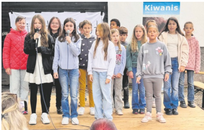
Auftritt des Grundschulchors der Sophie-von-Harder-Schule Sasbach

"Qi Gong im Stadtgarten" findet für dieses Jahr zum letzten Mal am Mittwoch 9. Oktober um 9.30 Uhr statt.