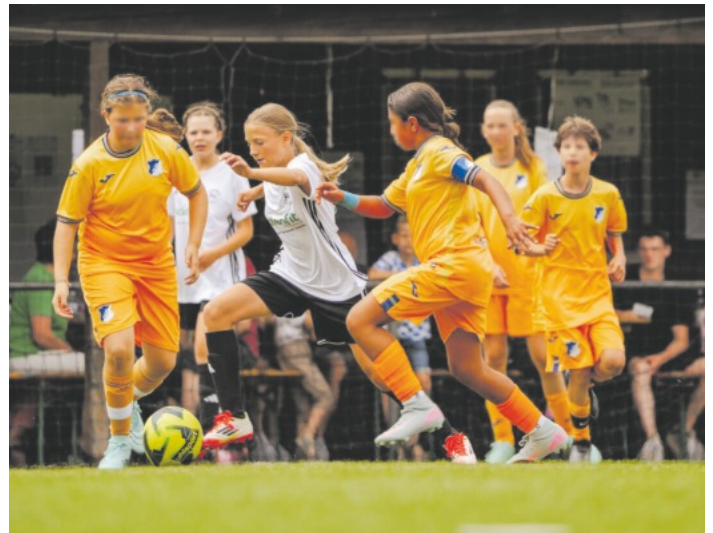
Soccer-Girls - TSG Hoffenheim

Auf Wiedersehen und bis zum nächsten Jahr. Wir freuen uns jetzt schon.