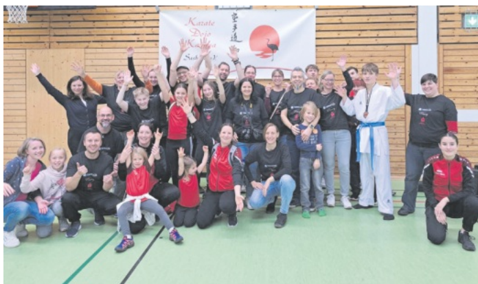
Als Ausrichter der Landesmeisterschaft möchten wir uns herzlich bei allen Helfern und Unterstützern bedanken!