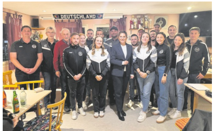
Vorstandschafft des SVO