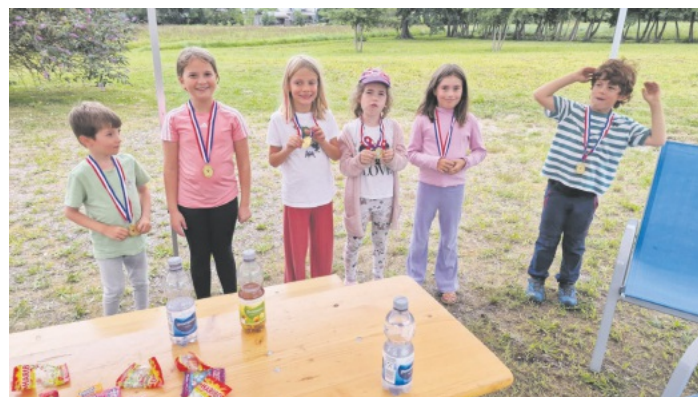
Die erfolgreichen Teilnehmer