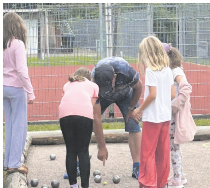
Welche Kugel liegt besser?