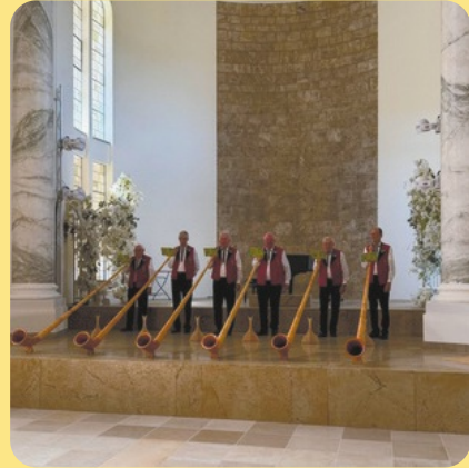
Windecker Alphornbläser in der ehem. Klosterkirche