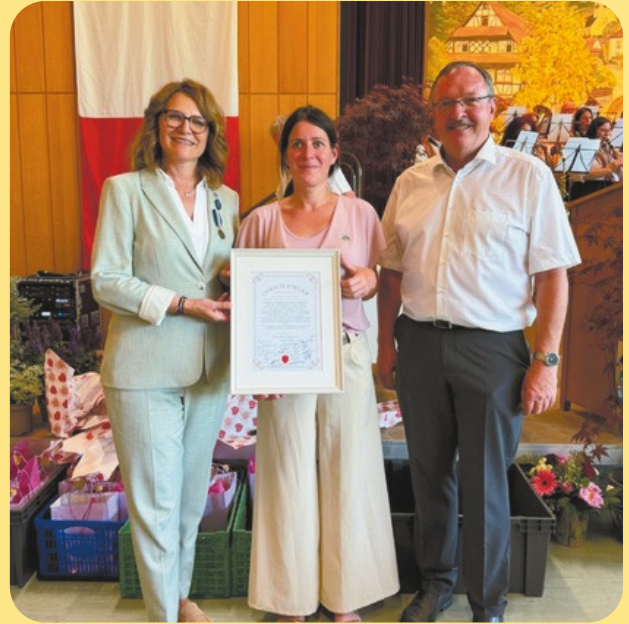
Übergabe der Partnerschaftsurkunde an Bürgermeisterin Burckel aus Marmoutier