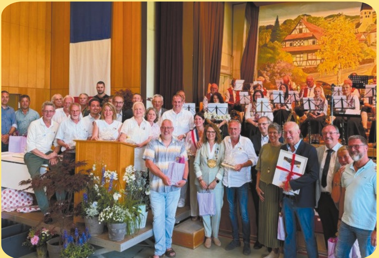
Gratulation durch den Gemeinderat, Ortschaftsrat und Gästen aus Marmoutier