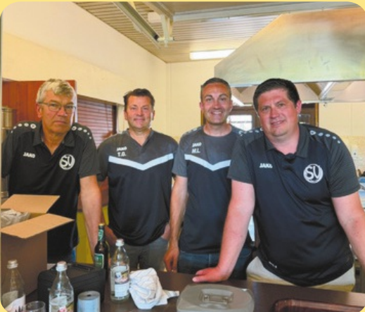
Das Thekenteam des SV Obersasbach