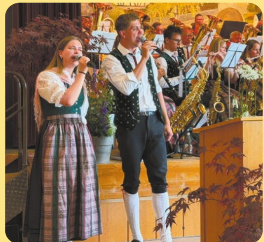
Geschwister Guggenbühler von der Trachtenkapelle Obersasbach