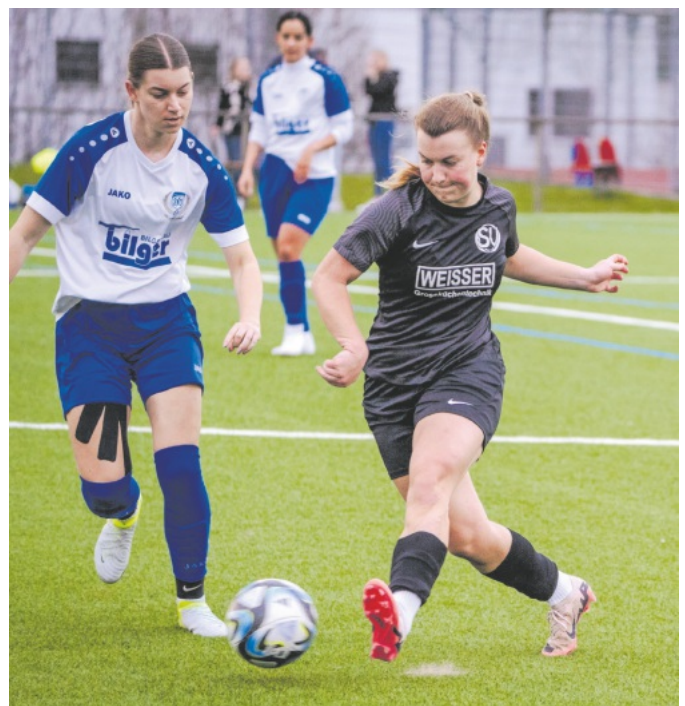
SVO - SpVgg Ottenau