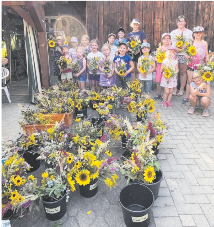
Am Ende waren Eimer und Wannen mit duftenden "Wihennen" gefüllt.