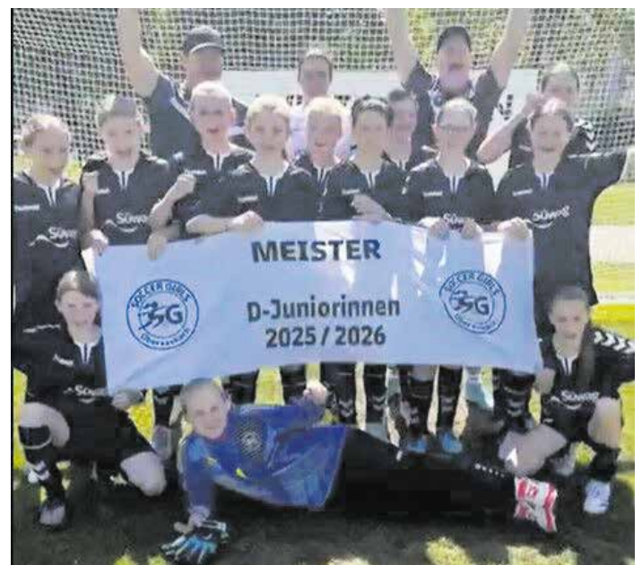
D-Juniorinnen der SG Obersasbach