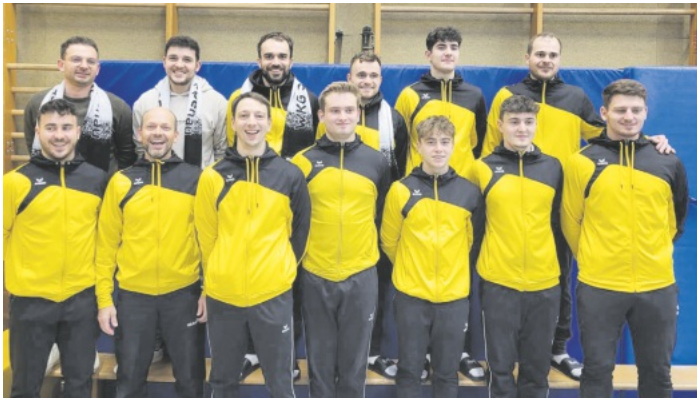
Die erfolgreiche Wettkampfgemeinschaft Sasbach/Renchtal mit Platz fünf, wie im Vorjahr.

Mehr Informationen hierzu auf www.sv-sasbach.de