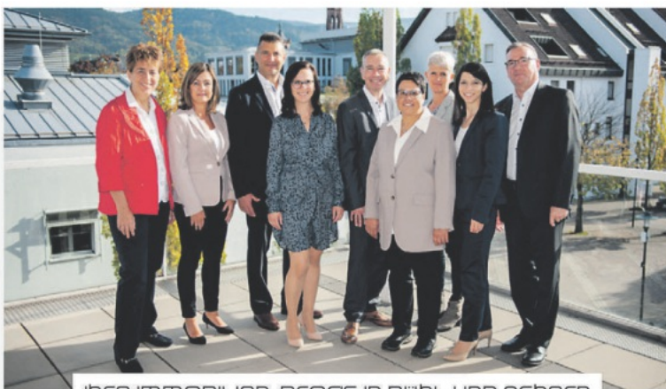
Ihre IMMOBILIEN-PROFS IN BÜHL UND ACHERN

IMMOBILIEN VERKAUF UND KAUF VERMIETUNG WERTERMITTLUNG FINANZIERUNG ENERGIEBERATUNG